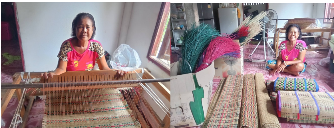
นางทองศรี โพธิ์ทัย เกิดเมื่อพ.ศ. ๒๕๐๘ อยู่บ้านเลขที่ ๔๕ หมู่ที่ ๑ ตำบลไพรขลา อำเภอุมพหลบุรี จังหวัดสุรินทร์ ท่านเป็นผู้ที่มีความรู้เรื่องการทอเสื่อและแปรรูปเสื่อจำหน่าย